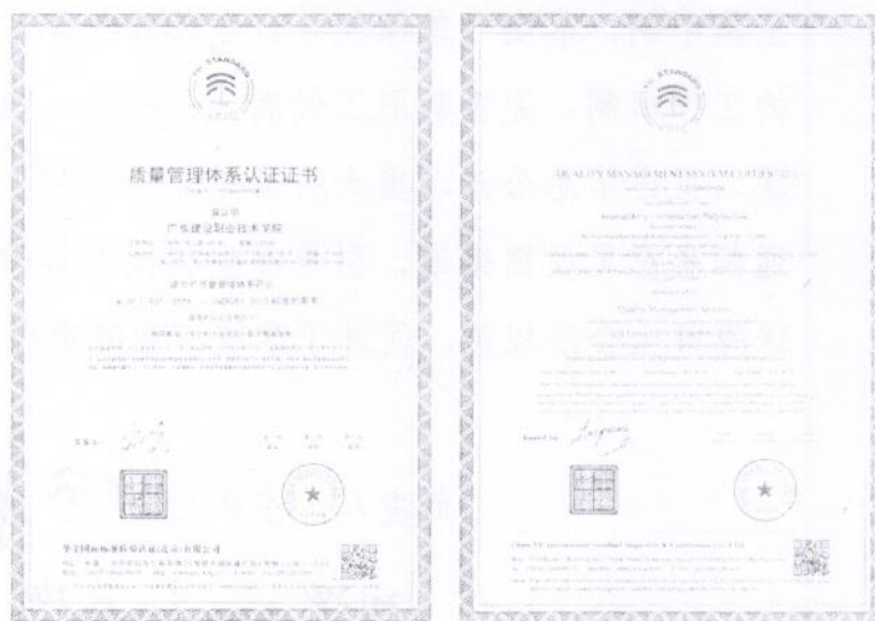
图：质量管理体系认证证书

4.提高了人才培养质量。 将基于过程管理的教学质量监控体系与基于结果评价的教学检查有机结合，以教学质量监测平台为依托，持续推进教学数据动态监测、预警和数据分析，形成学校、教学部门、教师各角色的智能画像和学生综合素质档案，有效提高了教学决策水平和能力，提升了人才培养质量。