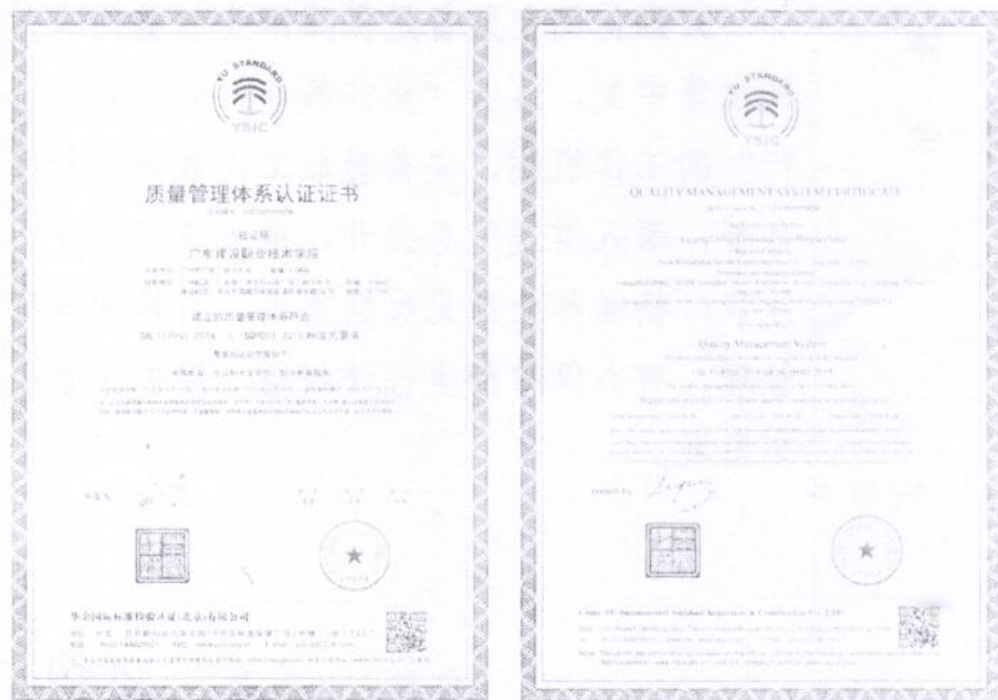
图：质量管理体系认证证书

4.提高了人才培养质量。 将基于过程管理的教学质量监控体系与基于结果评价的教学检查有机结合，以教学质量监测平台为依托，持续推进教学数据动态监测、预警和数据分析，形成学校、教学部门、教师各角色的智能画像和学生综合素质档案，有效提高了教学决策水平和能力，提升了人才培养质量。